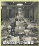
昭和30年代の雑誌表紙