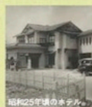
昭和25年頃の千草ホテル

千草ホテルでは2014年の生誕百周年に向けて過去の資料を集めています。お客様お手持ちの写真をあられば、ぜひ情報をお寄せください。