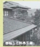
移転した料亭千草